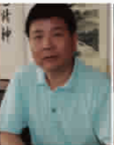
百姓装潢 每年为50000户上海家庭做好装修