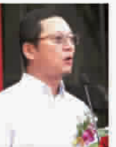
聚通装潢 2013年度再次蝉联市场年度前茅