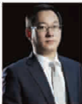
申远空间设计 中国最具影响力十大家居设计机构