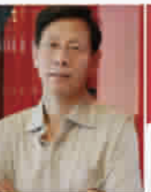
荣欣装潢 常年4大航母级实景展馆开馆迎客