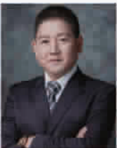
统帅装饰 连续5年荣获“消费者满意度领先品牌”