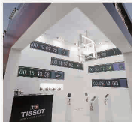
天梭为仁川亚运会特别设计未来感十足的计时陈列展区