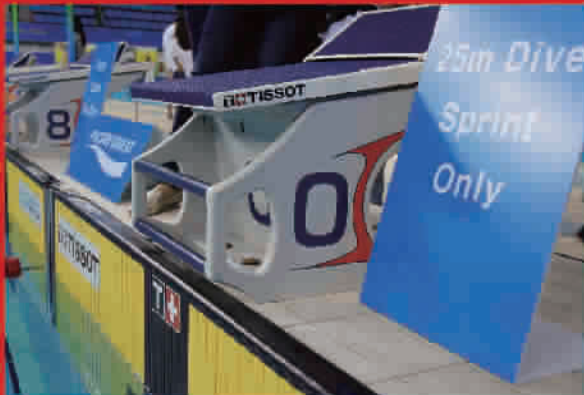
天梭专业计时设备,蓝色设备精准记录游泳比赛选手是否抢跳,黄色看板通过记录触壁情况计算最终结果(运动员进行接力或往返的时候,该看板也可以记录是否触壁)