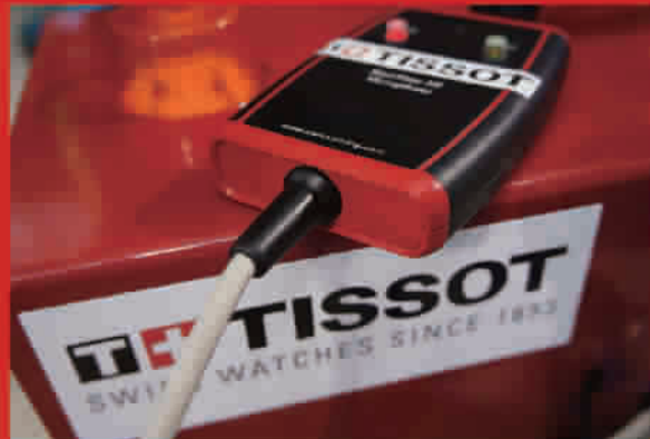
精准捕捉参赛选手是否抢跳的天梭专业计时设备