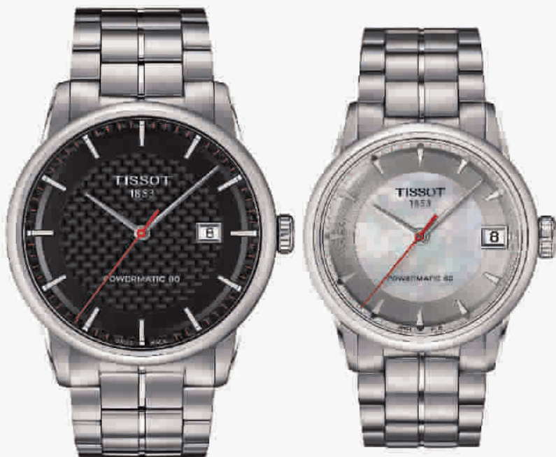
天梭豪致系列自动上弦2014亚运会限量版男表/女表