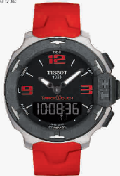
天梭竞速触屏系列2014亚运会纪念款