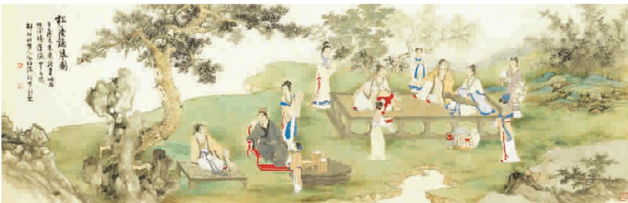
■ 郑伯萍郑明轩《松荫听琴图》