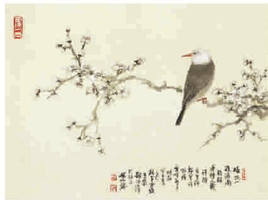
■ 郑伯萍《梅花一夜遍南枝》

2012年，美国多家博物馆馆藏的中国古代名画在上博展出，虽然其中大多数作品都有精美的印刷资料，明轩也已看得烂熟于胸，但原作对他的震撼仍是巨大的。他无数次到博物馆观摩，细辨其绘画技法和着色方法，体味其深厚悠远的古韵。其中唐人张萱的“捣练图”对明轩影响最大，通过仔细观察，学习图谱古论，大致摸索出了“捣练图”多层覆盖及透明色的罩染技法。