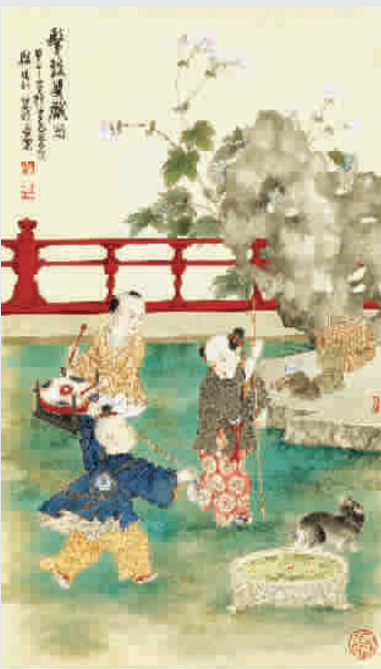
■ 郑伯萍郑明轩《击鼓耍戏图》