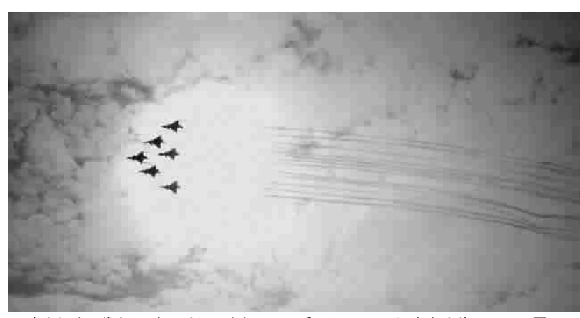
珠海航展开幕式上,空军首批歼击机女飞行员献上了炫丽的“空中芭蕾”

又讯(记者 叶薇)在第十届中国国际航空航天博览会上,刚果(布)交通部昨天宣布订购三架ARJ21-700飞机,包括两架ARJ21-700飞机及一架ARJ21-700飞机公务机。刚果(布)成为首个购买和运营ARJ21-700飞机的非洲国家。此前,在第49届范堡罗航展上,中国商飞公司与刚果(布)交通部签署了三架ARJ21-700飞机购机备忘录。与此同时,中国商飞公司与朗业(天津)国际租赁有限公司签署20架ARJ21-700飞机购机意向协议。朗业(天津)国际租赁成为ARJ21-700飞机的第17家客户,ARJ21-700飞机订单总数达到278架。中国商飞还与招银金融租赁有限公司签订30架C919大型客机合作备忘录。至此,C919大型客机已获得了来自17家用户的430架订单。