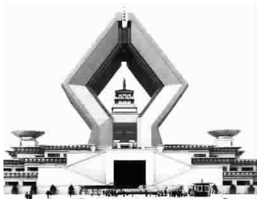
陕西扶风法门寺合十舍利塔,塔内供奉着释迦牟尼真身指骨舍利,落成于2009年

法门寺珍宝之奇之妙,难以一一尽述,当时考古挖掘的专家鉴定绝大部分的文物可定为一级甲等,即最高级别。大唐气象的物美丰盈、光华灿烂,在这一刻生动定格。