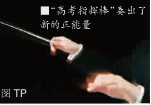
“高考指挥棒”奏出了新的正能量

本市从2016年起取消一本、二本院校之分,逐步改变以学校为本的填报志愿方式,转到以专业为本的填报志愿方式。一本、二本取消了,会给考生带来什么?记者采访中了解到,取消一本、二本,首先在沪上高中大受欢迎。一位重点高中校长表示,以前一直有一、二本率的评估,各校都为此暗中较劲,一本率一旦降低,哪个校长精神压力都特别大,如今取消了一本、二本之分,学校也减负了。这位校长认为,取消二本批次区别,不仅影响高校招生,或将牵动整个义务教育改革。因为,选拔人才的制度变了,培养人才的制度也要跟上。专业优先,将促使高中更重视学生的个性教育,有利于推动高中建立新的发展模式,创新人才培养机制。由于每名学生的专业爱好不同,高考科目不同,今后高