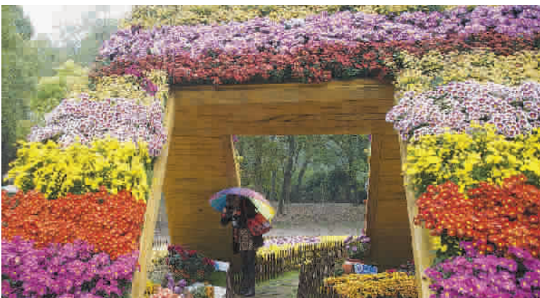
■ 万种菊花万种风情