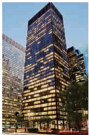
纽约地标建筑施格兰大厦

1987年，罗森搬到纽约，做了一阵地产经纪人，1991年与“发小”一起创立RFR股份有限公司，开始房地产投资。收购利华大厦等地标建筑并花大价钱翻修的举动，为他这个“外来者”在纽约地产和文化界奠定了名声和地位。2002年，对利华大厦的成功翻修还使他受到地标保护学会的嘉奖，纽约州州长安德鲁·科莫任命他为纽约州艺术委员会主席。