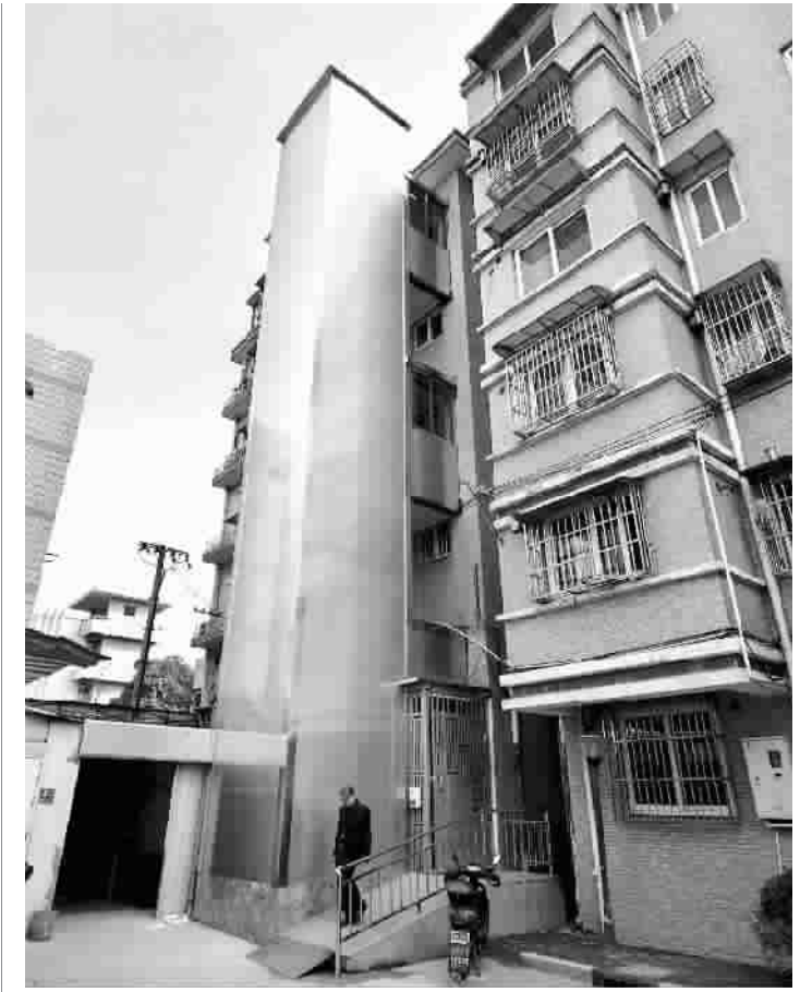
今年1月,密山路30弄4号老公房装上了电梯

本报讯(记者 宋宁华)今天是个国家宪法日,12月1日至7日是上海市第26届宪法宣传周。今天上午,由上海市法宣办主办、黄浦区法宣办承办的上海市法治电影周启动仪式在国泰电影院举行。启动仪式上,通过播放上海法治文化宣传片和法治电影周片花,展示了2014年上海法治文化建设成果,以及本届法治电影周展映电影的概况。有关负责人还为今