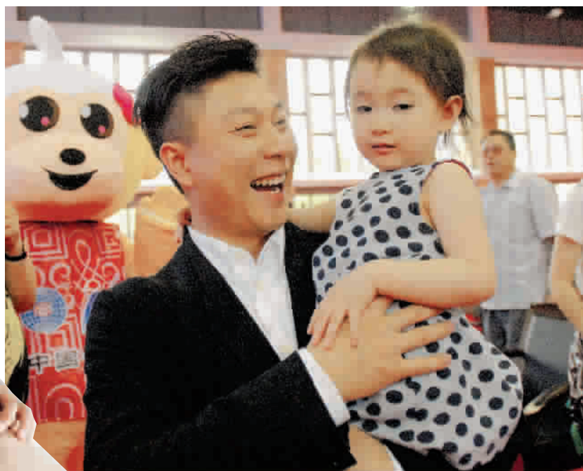
▲ 李小鹏怀抱奥莉 越看越欢喜