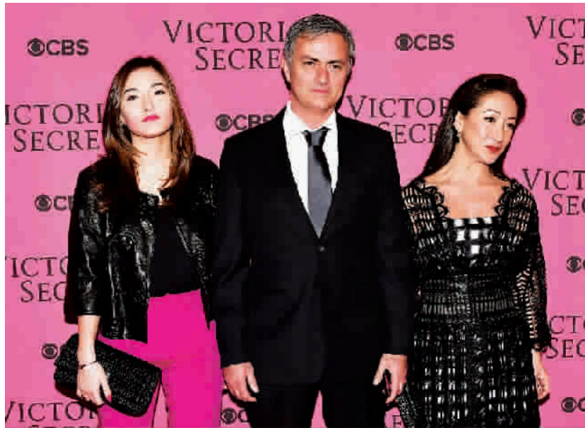
■ 穆里尼奥一家三口出席时装秀