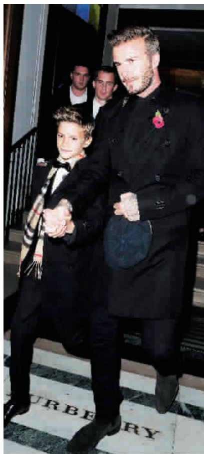
■ 贝克汉姆和罗密欧逛街遭围观