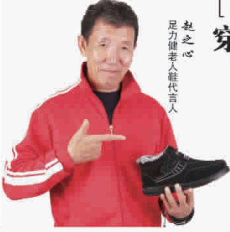
足力健老人鞋代言人 赵之心

收缩腕口 高帮收缩腕口，能阻隔冷空气从脚跟入侵，在冬天潮湿的地面，能保持身体的平衡，防崴脚。