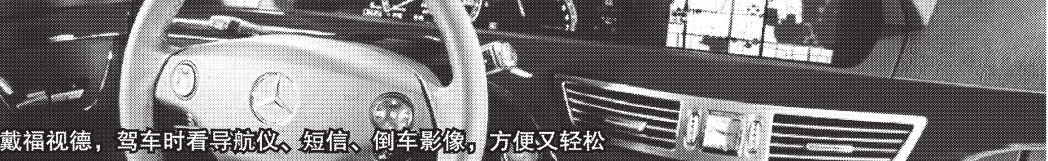
戴福视德，驾车时看导航仪、短信、倒车影像，方便又轻松