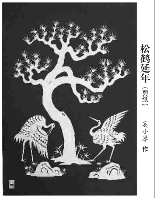
松鹤延年 (剪纸) 奚小琴作

炒饭家的店堂颇为宽敞,宽敞而黧黑,显得并不那么坦荡。尚未到达用餐高峰时间时,店里已经热得令人窒息。外加沿路金纸味扑鼻,我有些走神,在锅铲反复摺起饭粒的过程中想起了飘香的故乡心事。五点钟响时,抬头猛地一见关公脸,手还被赤裸上身的老板交递给我的饭油烫到,这才真的回过神来,踉跄而去。心里也不知跌宕个什么劲头,那一刻天际紫色的晚云看着我,一定像看到一个笑话。