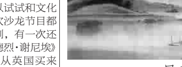
风和日丽 (中国画) 恽甫铭

退休后,我有更多的时间调剂生活,吃小馄饨,包小馄饨自然成了休闲的一大乐趣。随着口味和需求的变化,小馄饨的馅料也不断增加,除了常例的鲜肉外,又增加了菜肉、虾蓉、蟹肉、荠菜等品种,很是丰富。