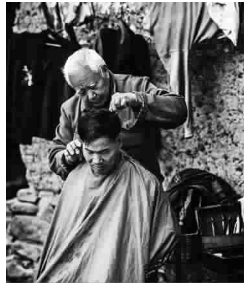
乡村理发师

报上说,有些史学家操着“江湖腔”在电视上说“正史”,有点像小茶馆里的说书人。真正冤枉煞哉!其实评弹是很难学的,一点也不“江湖腔”。