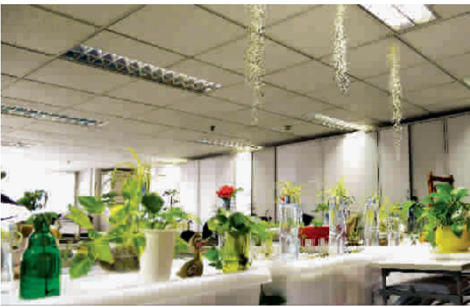
十佳最美绿色办公室

我家阳台不仅有花草,还有歌声委婉的金丝雀,有蛴蛴等鸣虫,更有斑斓的锦鲤。阳台四季有花,春有朱顶红、石斛兰和矮牵牛等的艳丽;夏秋有蓝雪花、玉簪、翠芦莉等的素雅;冬有墨兰、水仙的幽香。听鸟语虫鸣、闻花香、看鱼欢,阳台绿化休闲惬意,其乐无穷。 浦东新区 龙键