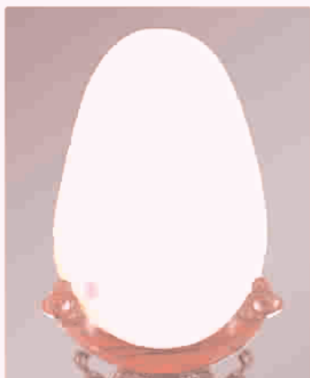
2011年中国玉石雕刻工奖金奖