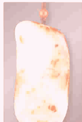
2013年中国玉石雕刻工奖金奖