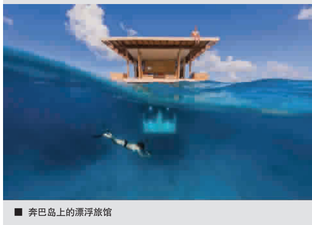
■ 奔巴岛上的漂浮旅馆