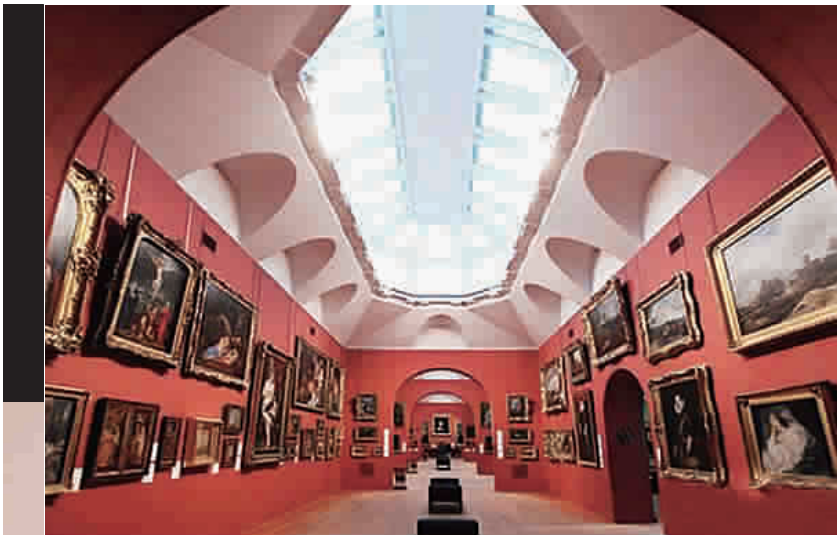
▲ 多维茨画廊馆藏古典大师杰作(图1C)

这次的活动除了“找茬”,另一个关键词就是“复制品”。好的艺术复制品甚至可以以假乱真,复制品的价值也往往和其仿真程度成正比。不过这次出现的“复制品”起到的作用更有意义,当它和几百件古典大师真迹一