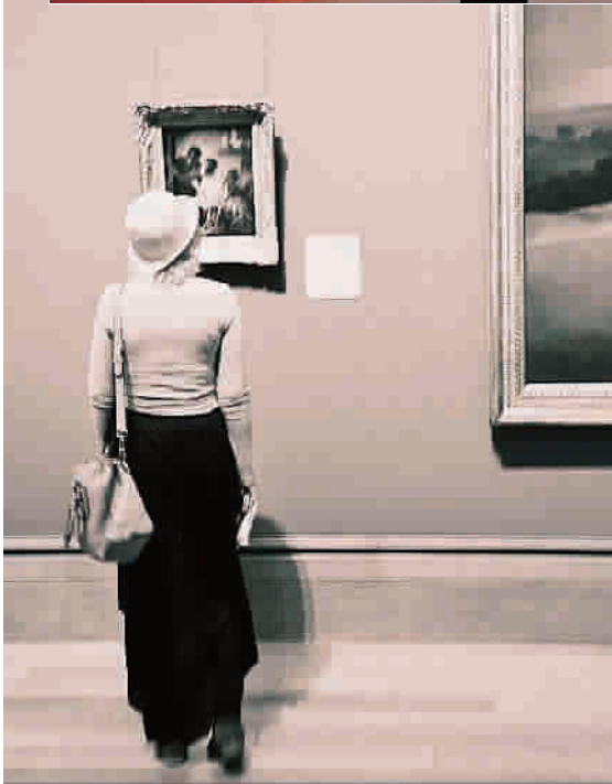
◀ 观众需要通过自己的观察力,来对比出真迹的可贵

起挂在墙上展示的时候,它就成了一面“镜子”,观众需要通过自己的观察力,来对比出真迹的可贵。