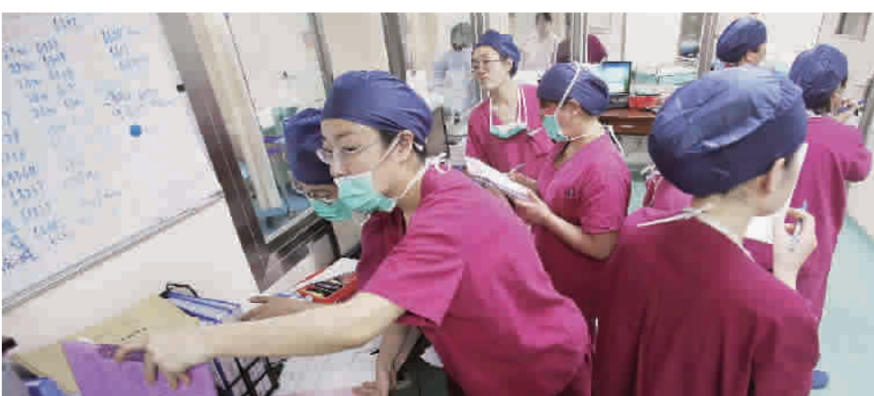
>>> 复旦大学附属妇产科医院(杨浦区)的产房办公室内,助产士们正忙着交接班