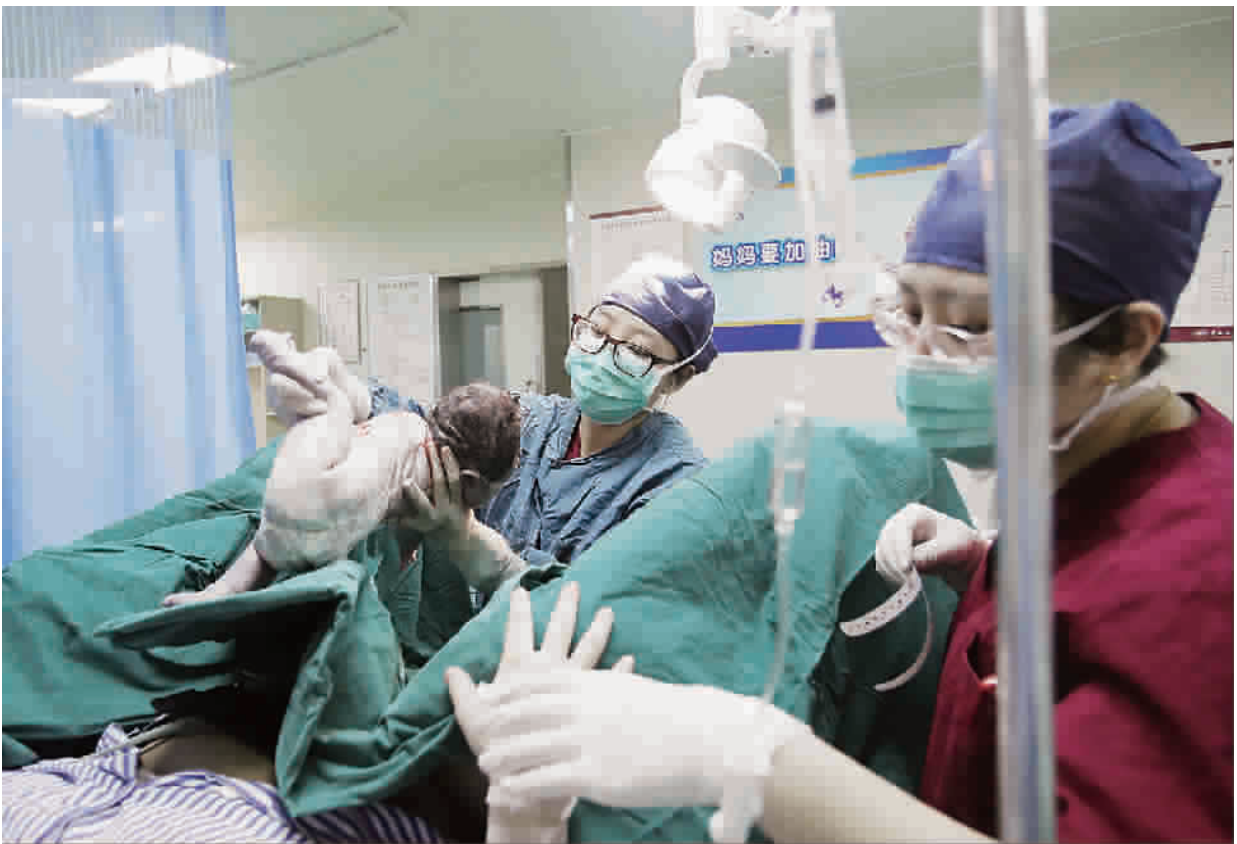
助产士们可以独立完成顺产的接生工作

经过十月怀胎,宝宝即将离开母体,呼之欲出,然而初为人母,分娩的过程令产妇感到陌生甚至恐惧。观察产妇生命体征、心理状态、产程进展以及胎儿情况,产房里助产士奔忙不断,她们既是产妇自然分娩的陪伴者,是顺产产妇的“接生婆”,也是产妇产后护理的好“闺蜜”。