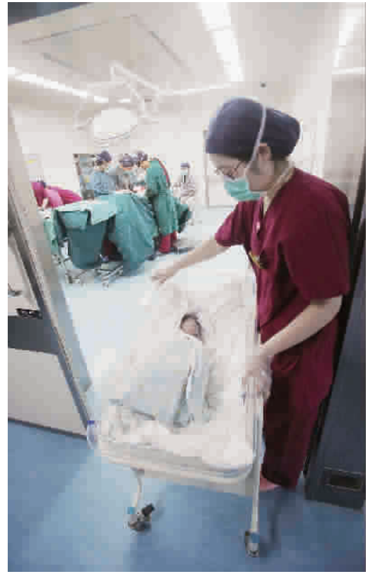
剖宫产手术室里也离不开助产士,一名助产士推着新生儿走出手术室,与等待已久的家属见面