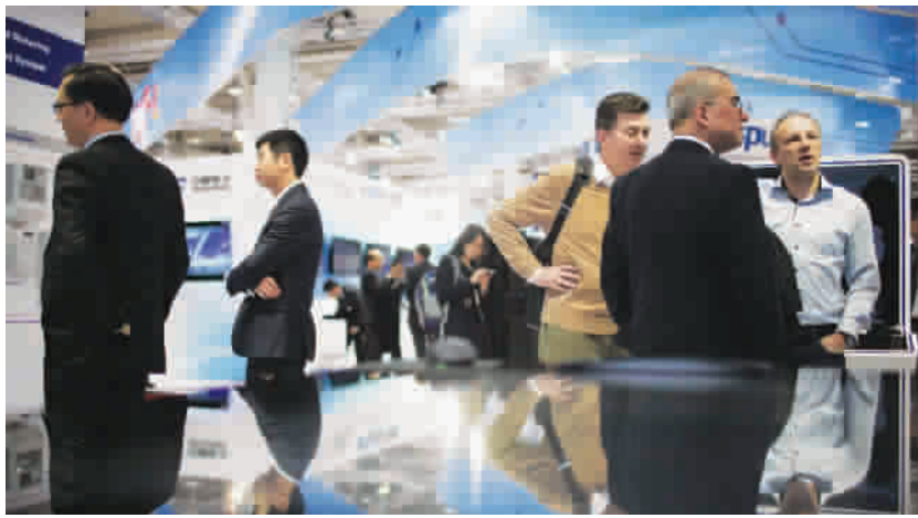
与会者在德国汉诺威IT展展区交谈

中国副总理马凯和德国总理默克尔共同出席15日晚的开幕式,并发表演讲。默克尔对中国目前的研发能力给予了极高的赞赏。她表示,中国是德国在亚洲最大的贸易伙伴,也是高科技研发领域的重要合作伙伴。德中在“数字经济”领域各有所长,两国就此展开合作可以实现优势互补。马凯副总理则为发展通信和信息技术提出了四点倡议:勇于变革创新,共促产业繁荣,坚持开放包容,确保信息安全。