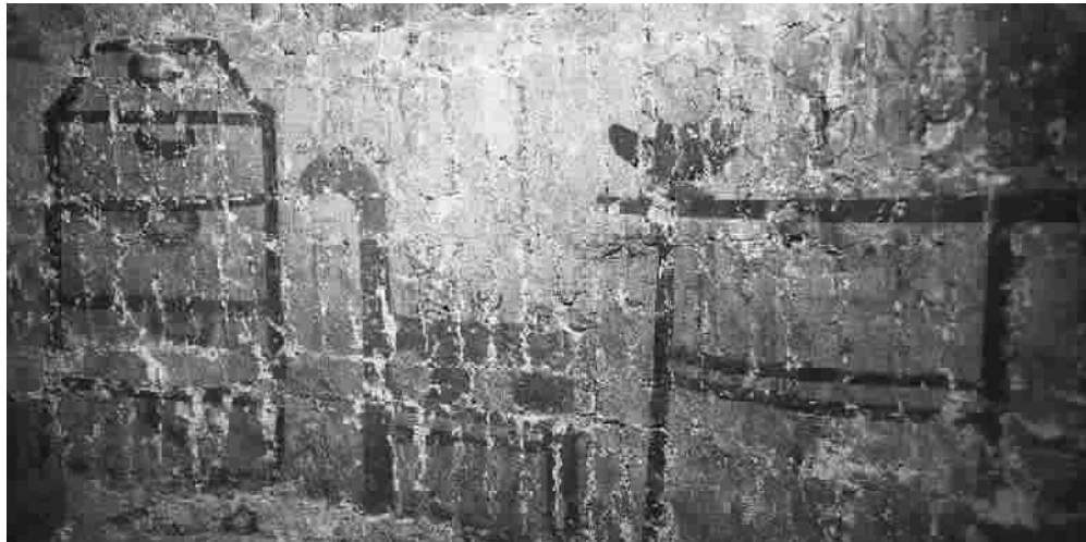
■ 辽金时期墓室中的壁画

墓室内出现了砖仿木结构和仿家具装饰,仿木构主要是墓室内施斗拱、立柱等建筑构件,仿家具主要是桌椅、门窗、灯等。这使得原本简单的墓葬有了“营造”的气息,即前期设计后期施工。同时,这种装饰客观上反映了当地居民生活方式的变化,具有划时代意义,对后代的家具陈设布局、日用器具的生产以及人们的审美都造成了深远的影响。墓室内出土有白瓷器和漆器,其中漆器的发现为北京地区所罕见。