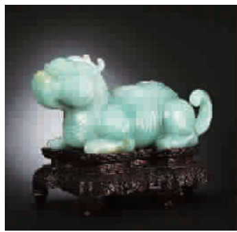
▲ 清乾隆 御制翡翠雕辟邪水丞 成交价: RMB 49,450,000

保利十周年春拍征集明天起在上海举行。保利拍卖的有关人士表示:今年十周年庆典,保利将坚持精品低价的路线,以数十年经验重点打造书画夜场,以“三石两鸿(虹)一大千”(齐白石、吴昌硕、傅抱石、黄宾虹、徐悲鸿、张大千)为龙头。夜场安排中,我们亦会加强私人收藏专场,将与海内外民间美术机构、台湾、新加坡、美国、印度尼西亚等地区的全球知名收藏机构,如清翫雅集等,开展多方面合作。此外,在日场上还将推出海上画派等地区画派特色专场,梳理中国近现代书画、探索当代水墨的“中国水墨三十年专场”,以及适逢纪念世界反法西斯战争胜利70周年的钱大钧旧藏蒋介石百余封亲笔密令等抗战文物,其他专场也各有特色,希望广大藏家共襄盛举。