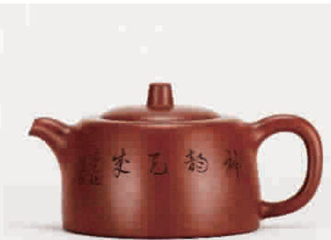
▲ 顾景舟、魏紫熙合作 矮井栏壶 成交价:RMB 10,350,000