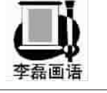
听说桃花开了/在三十六里地外/我放下活计/背起挎包/打壶清水/揣个馒头/步行/三十六里/去看桃花