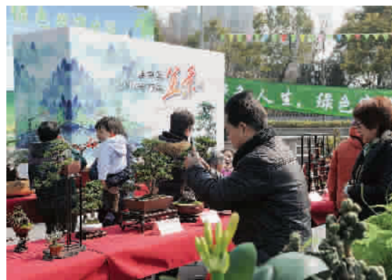
盆栽技艺送进社区