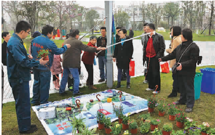
市民参与趣味活动,提升绿化理念