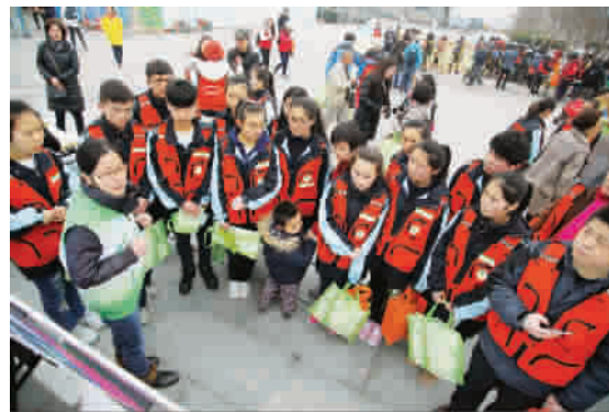
热心志愿者在行动