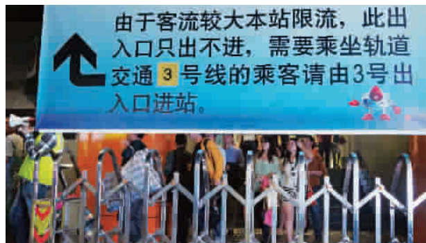
◀轨交一号线上海南站实行限流措施

滴水湖游客8万人,欢乐谷游客3万人,自然博物馆游客逾万人……“五一”小长假首日,晴好的天气使得本市多处景点游人如织。昨天下午3时半开始,公安、武警联手在南京路步行街和南京东路外滩等地设立临时