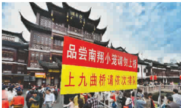
◀记者今晨在豫园看见,九曲桥畔设置了警示牌与蛇栏