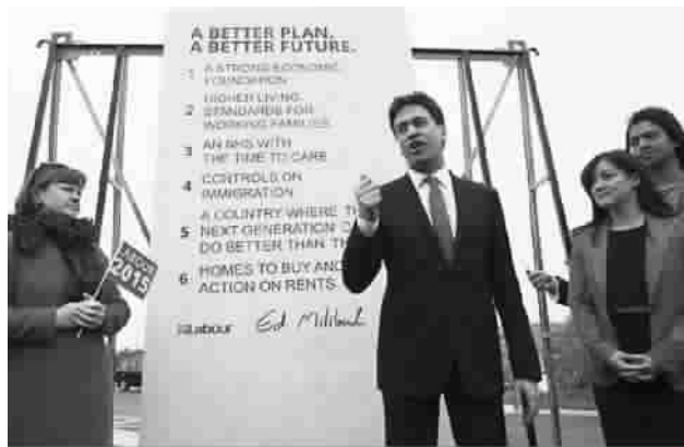
■ 米利班德把竞选承诺刻在“纪念碑”上