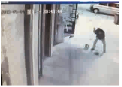
▲男子用脚及扫帚殴打男童 视频截图 ▶被打男孩颅骨骨折

昨日,一段“男子殴打扫地男童”的视频在网上引发广泛关注。事发地点位于陕西省延安市洛川县汉中街,目前,警方已将打人男子刑拘,受伤男童无生命危险,已经出院。警方表示,打人男子患有精神分裂症。