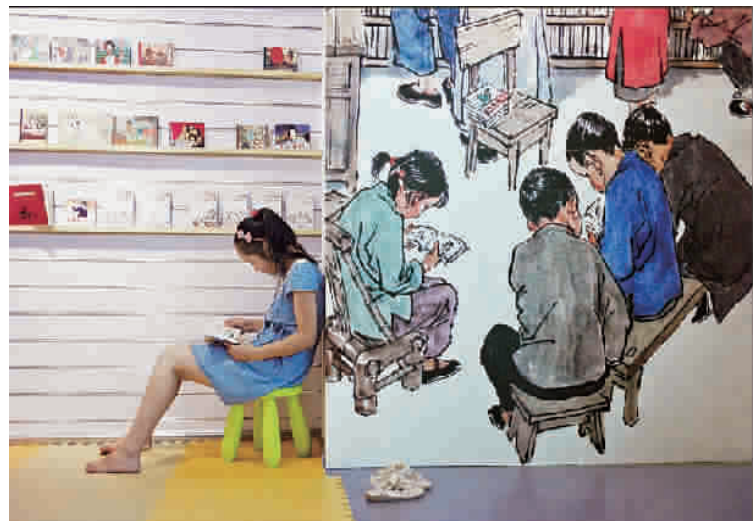
■ 《阅读》利用宣传画突出主题