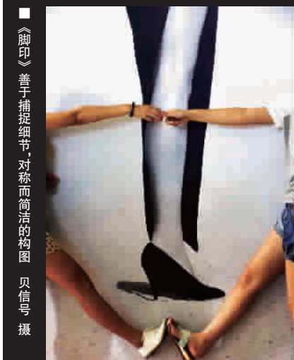
■ 《脚印》善于捕捉细节,对称而简洁的构图

总之,街拍没有什么固定样式,只要手快、脚快、眼快,善于发现,善于捕捉,那么情趣与趣味就自然而生。