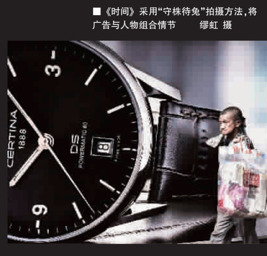
■ 《时间》采用“守株待兔”拍摄方法,将广告与人物组合情节