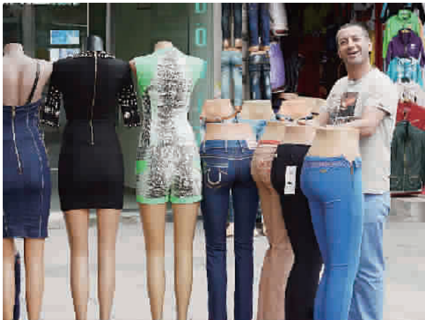
■ 《模特》将没有关联的人物与模特构成情节

我很难形容这个画面给当时的我带来的感受,很复杂又好像很简单,他们都入了迷。而转念一想,他们成为了我眼中的风景却不自知,而我们却也为他们所着迷了不是?或许,当我拍下这个画面时,我也成了别人眼中的景。