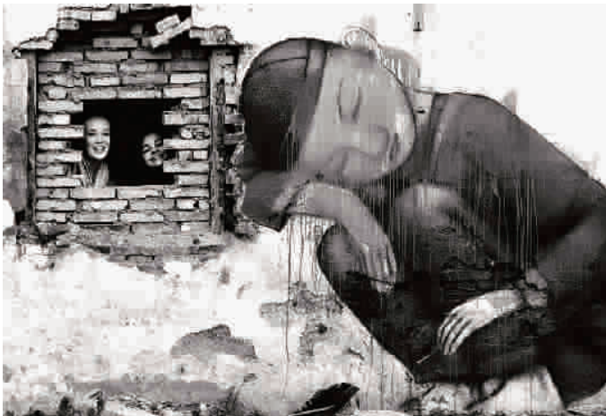
■ 《捉迷藏》是涂鸦更是童趣的写真

如果说风光美景、抽象光影的拍摄更多考验的是摄影者的拍摄技巧运用以及光影角度选择,那么街拍则可以说是一种更全面要求的拍摄类型,因为街头上的风景时刻发生着变化,一旦错过某个瞬间,也许就和最精彩的画面擦身而过了。如果没有一颗小心,没有一双巧手,恐怕很难展现出街拍的情趣来。