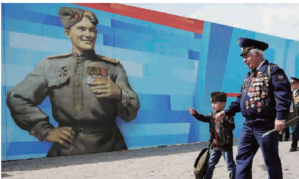
一名老兵与自己的孙子在胜利日庆典结束后离开红场

历史教育是俄爱国主义教育的主要切入点。俄罗斯将重要的历史日期定为国家节日,作为历史教育