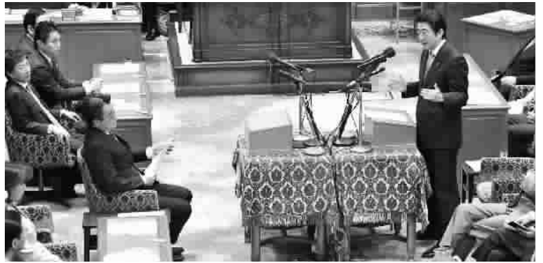
安倍与日本最大反对党日本民主党党领导人冈田克也(左前排者)在国会一对一辩论

1945年7月26日,中美英三国在德国柏林西南的波茨坦发表敦促日本投降的《波茨坦公告》,公告还敦促日本履行中美英三国于1943年12月发表的《开罗宣言》。《波茨坦公告》和《开罗宣言》是构成战后国际秩序的重要基础文件。