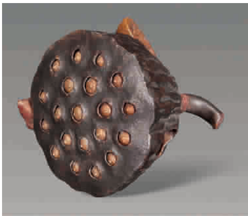
■ 清早期 陈鸣远双色莲蓬水盂

上海敬华2015春季艺术品拍卖会将于6月29日—6月30日在上海静安香格里拉大酒店举行(延安中路1218号), 预展时间为6月27日—28日。设有中国古代书画、近现代书画、古籍信札、油画雕塑、历代瓷器、名家紫砂、文房雅玩、翡翠珠宝等几大门类专场, 名家荟萃, 佳作云集, 备受关注。这几天, 在铜仁路92号三楼, 举办敬华春拍精品展, 部分春拍精品(中国书画、油画、瓷器、紫砂、文玩、古籍等)提前亮相, 欢迎广大藏家和爱好者前来参观。