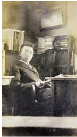
■ 胡适赠胡近仁小诗照片正面

在今年的艺术品拍卖市场上，手稿继续展现着其“黑马”的形象，特别是在那个没有微信的时代，如何了解名人“朋友圈”中的故事，手稿无疑是最好的研究对象。在今年嘉德春拍上，一组“胡适、朱自清、丰子恺等签名本”最终以将近估价8倍的101.2万元的价格成交。而在即将于今年朵云轩出现的胡适等民国名人未刊信札，则将掀起新一轮的手稿收藏热。