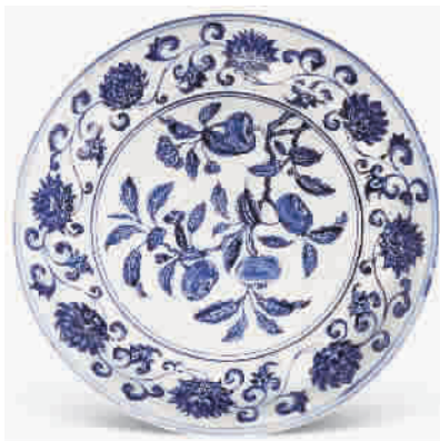
■ 明宣德 官窑青花花果纹大盘