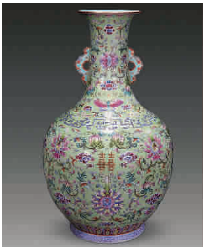
■ 清嘉庆 绿地粉彩缠枝莲纹喜字瓶