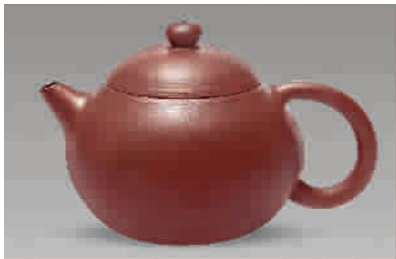
■ 顾景舟朱泥西施壶