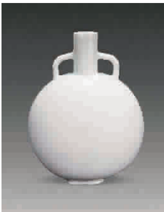
■ 清乾隆 仿永乐粉青暗刻花卉双耳扁瓶