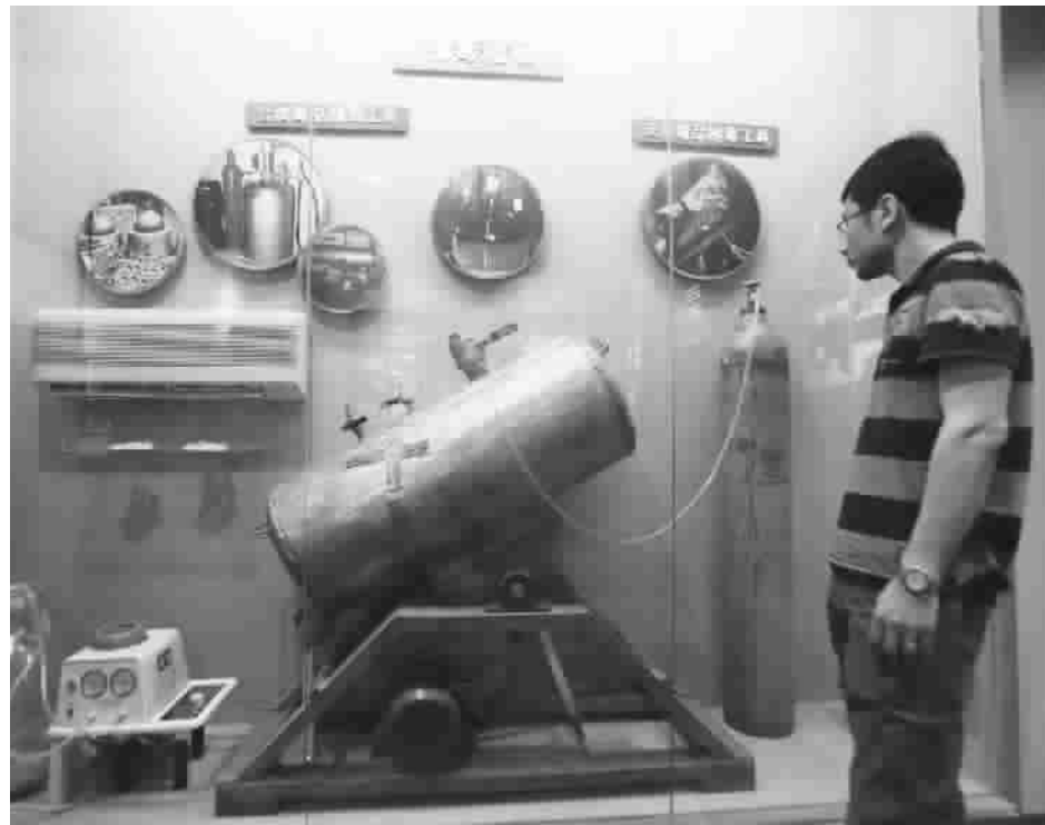
6月23日，上海公安高等专科学校禁毒馆开馆