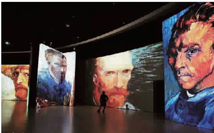
■ “不朽的梵高”感映艺术展效果图