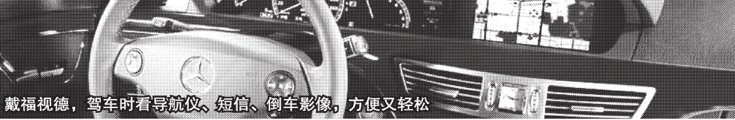
戴福视德，驾车时看导航仪、短信、倒车影像，方便又轻松