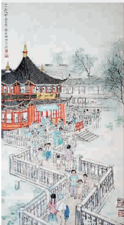
■ 李君秋《豫园湖心亭》