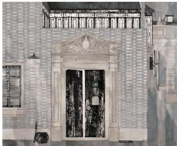
■ 丁筱芳《上海石库门》