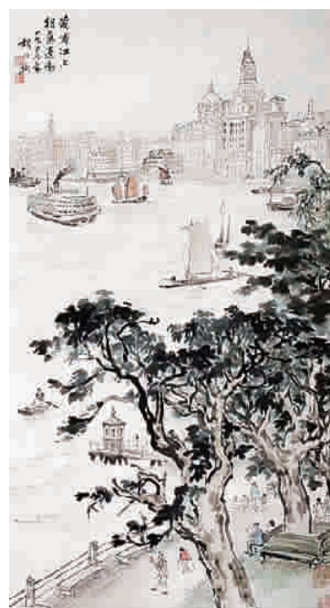
■ 胡伯翔《黄浦江上朝气蓬勃》