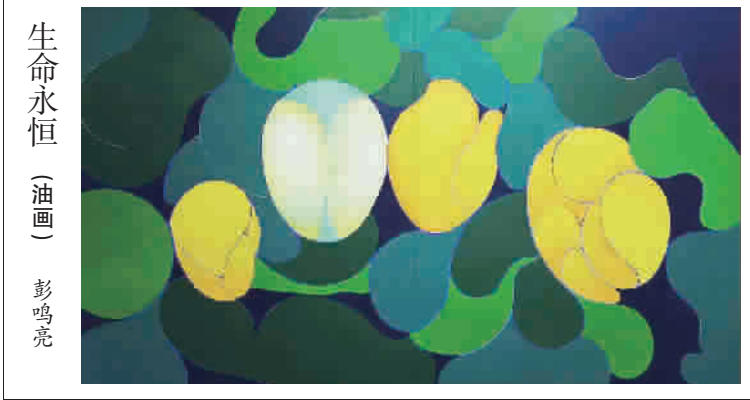
生命永恒 (油画) 彭鸣亮

在我退休后拍的一大堆照片里,有一张格外显眼:湛蓝的天空下,八名老人一字排开,后面停泊着退休的航母,旁边矗立着著名的“胜利之吻”雕像,大家做着欢庆的手势,其乐融融好像久别重逢的老友……其实八个人是来自两个不同的国家,四名中国人、四名阿根廷人,这张“国际照”是怎么出炉的?要从一次美国旅游说起。