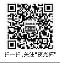
扫一扫,关注“夜光杯”

敬根据抵制运动迅速在全国蔓延的趋势,断定日元汇率回升无异于回光返照,决定再变多头为空头,且大张旗鼓地抛售日元,以在社会上造成声势和影响。上海各银行和钱庄,甚至包括欧美商人和洋行,一时间丈二和尚摸不着头脑,不得不跟风大