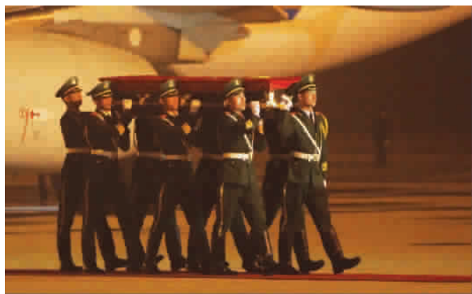
张楠烈士灵柩被抬下飞机