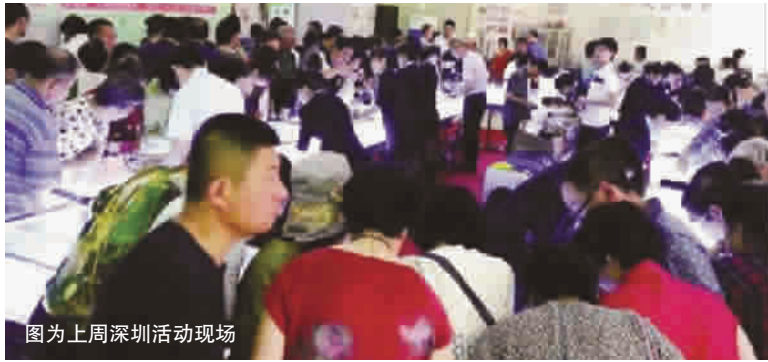
图为上周深圳活动现场

“喂, 依好, 我想买一个好一点的碧玉手镯, 请帮我留一个吧。”“你们那里有没有冰种的如意挂件? 还有带翠的手镯呢?”“不会真的这么便宜吧? 我想选几个和田玉雕件送朋友, 可以刷卡吗?”自从“翡翠和田玉大型直销惠”的消息传开以后, 热线电话 400—8080—285 几乎被打爆, 8 位接线员忙得不亦乐乎。目前共接电话 2000 多个, 电话中有要预订手镯挂件的, 有问地址的, 有想要免费鉴定的, 还有问活动时间的, 能否刷卡的等等。不难看出, 咱们上海人对翡翠和田玉有着极高的品位和需求。据主办方介绍, 本次参加活动的人数有可能会超过 3000 人, 提醒广大消费者活动只有 4 天时间, 想要超低价买翡翠和田玉的朋友可要抓紧时间了。