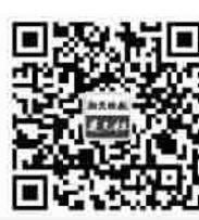
扫一扫,关注“夜光杯”

上是包容与合作的结果。不同地域的不同文化能够在这里交汇、融合,融合产生的合力为老闵行当时的发展和繁荣提供了人文动力,这就是“非遗”的魅力。那么,我们对本地的历史文化,比如像传统江南集镇这样的物质文化,也要有更多的包容,因为本地的历史文化,是我们海纳百川的根脉所在。