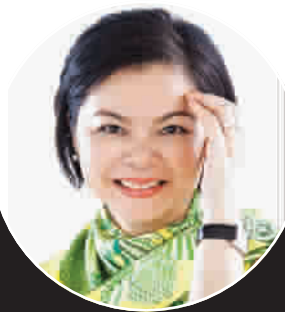
■ 本版图片均为简名敏作品

简名敏 ：我的设计原则就是软装设计还是要兼具明确的功能，不能只为了视觉效果而设计。另外，任何软装设计都应该是整体协调的，有些东西再美再好看，只要它不适合整体的空间，我也不会采用。再者，软装的材质无分贵贱，只要是在合适的时间，用在合适的地方，能够达到一个和谐的空间效果，它就是我需要的材料。在这一点上，软装设计和花艺设计是相通的，合适与协调才是最美的。