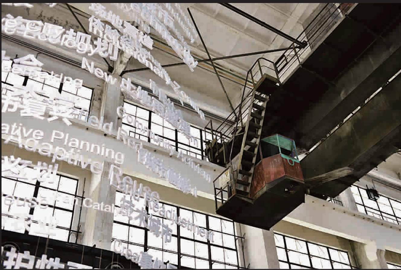
■ 飞机库展览“序曲”:老物件上起飞新空灵