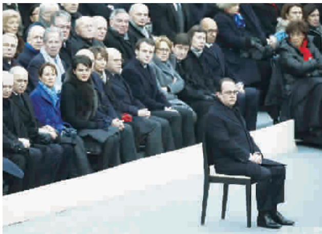
奥朗德(前)在悼念仪式上