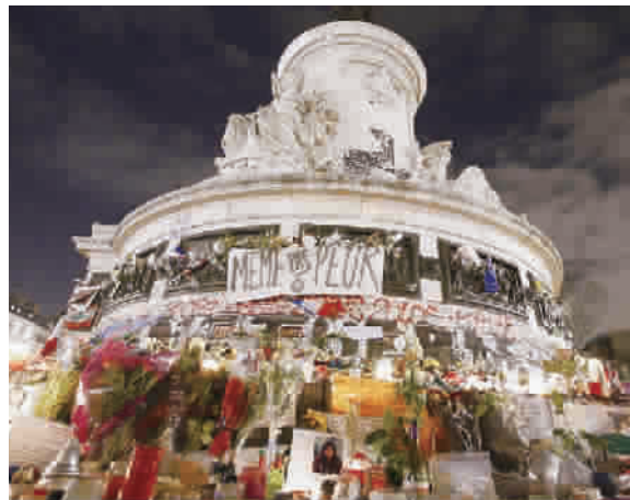
向遇难者献上的鲜花和蜡烛