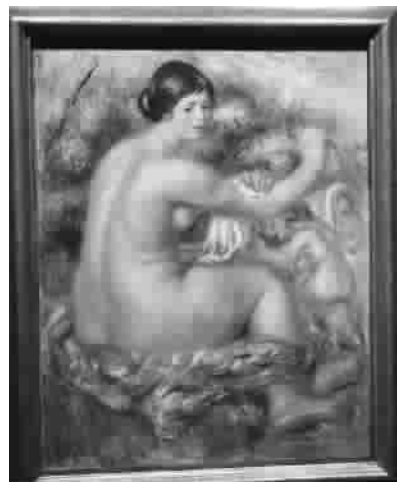
雷诺阿《沐浴后》

雷诺阿、毕加索、达利、米罗、达芬奇……这些西方美术史上的一流艺术家冠名的展览,近日同时在上海各个艺术场馆和商业地产里开展,申城的商业特展从未那么热闹过。但是,虽然有些展览吸引了不少观众,但也有买票参观者提出,部分展览根本无法值回票价,名不副实的背后到底有什么样的玄机?如何识破展览的花样经呢?