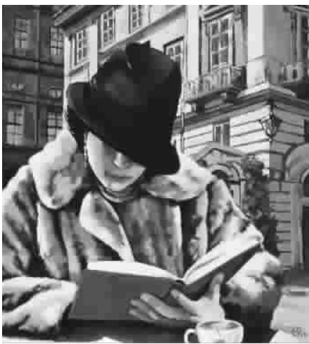
全神贯注 (油画) 罗沙

我们是从上海出发到到河南旅游的“夕阳红老年团”,一行45人,都是上海人。列车到郑州站,当地旅行社派了大巴来接,导游小张按合同的编号,喊着名字叫大家排队上车。这时车门前来了两个满头白发的老人,看样子有八十多岁。老头身体还好,老太太佝偻着身子,腰弯得像只煮熟了的大虾。大家见状,都客气地闪开,让他俩先上车坐在前面。