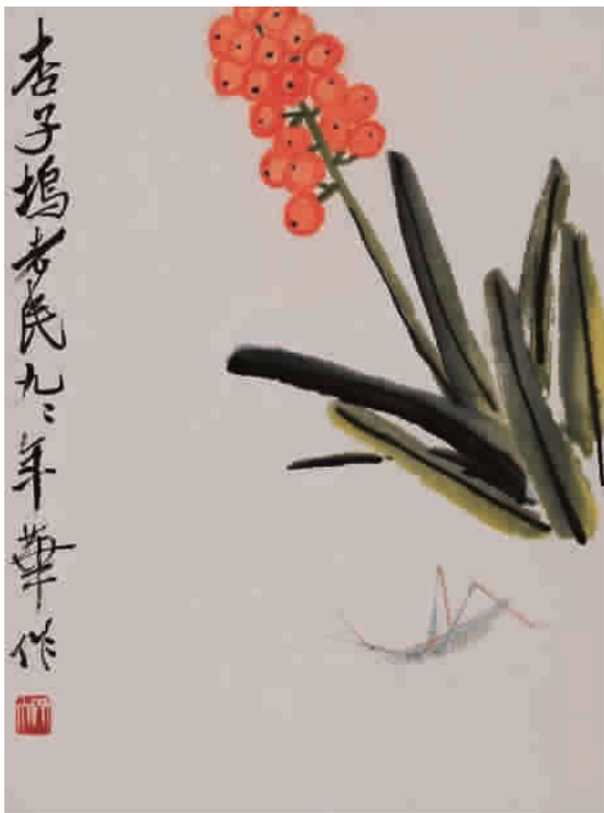
齐白石《叶隐闻声》草虫册页之一开

价,最终以1亿元落槌,1.15亿元成交。本套册页是齐白石绘画生涯中极为精彩,也数量最多的一件顶级草虫册页,共十八开,其中的两开在1955年中央新闻纪录电影制片厂纪录片《画家》中即已出现。1959年胡佩衡著《画法与欣赏》中已著录,此后几十年经多次出版。据原北京荣宝斋副总米景扬回忆,这十八开一直分六个镜框挂在荣宝斋会客室墙上,后经两次交易被著名收藏家霍宗杰一直完整保留至今。齐白石一生中所绘的花卉工虫册页数量极其有限,因其费时费眼所以只有对于极其重要的人物才会聚不知多时之力画齐一册。 德安