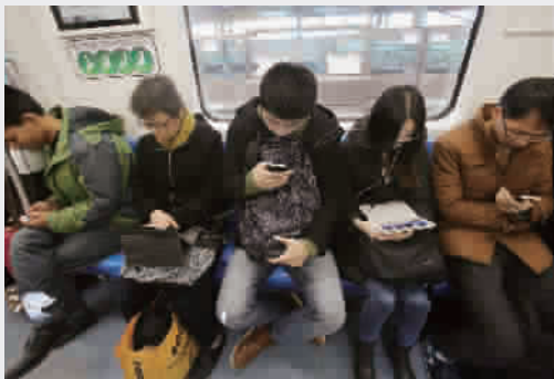
■ 地铁里,几乎人人都低着头