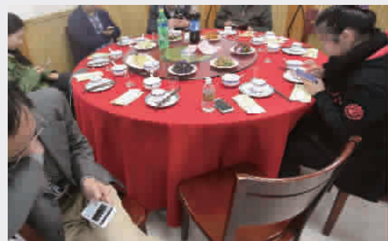
■ 开饭前,边等朋友边看手机解闷