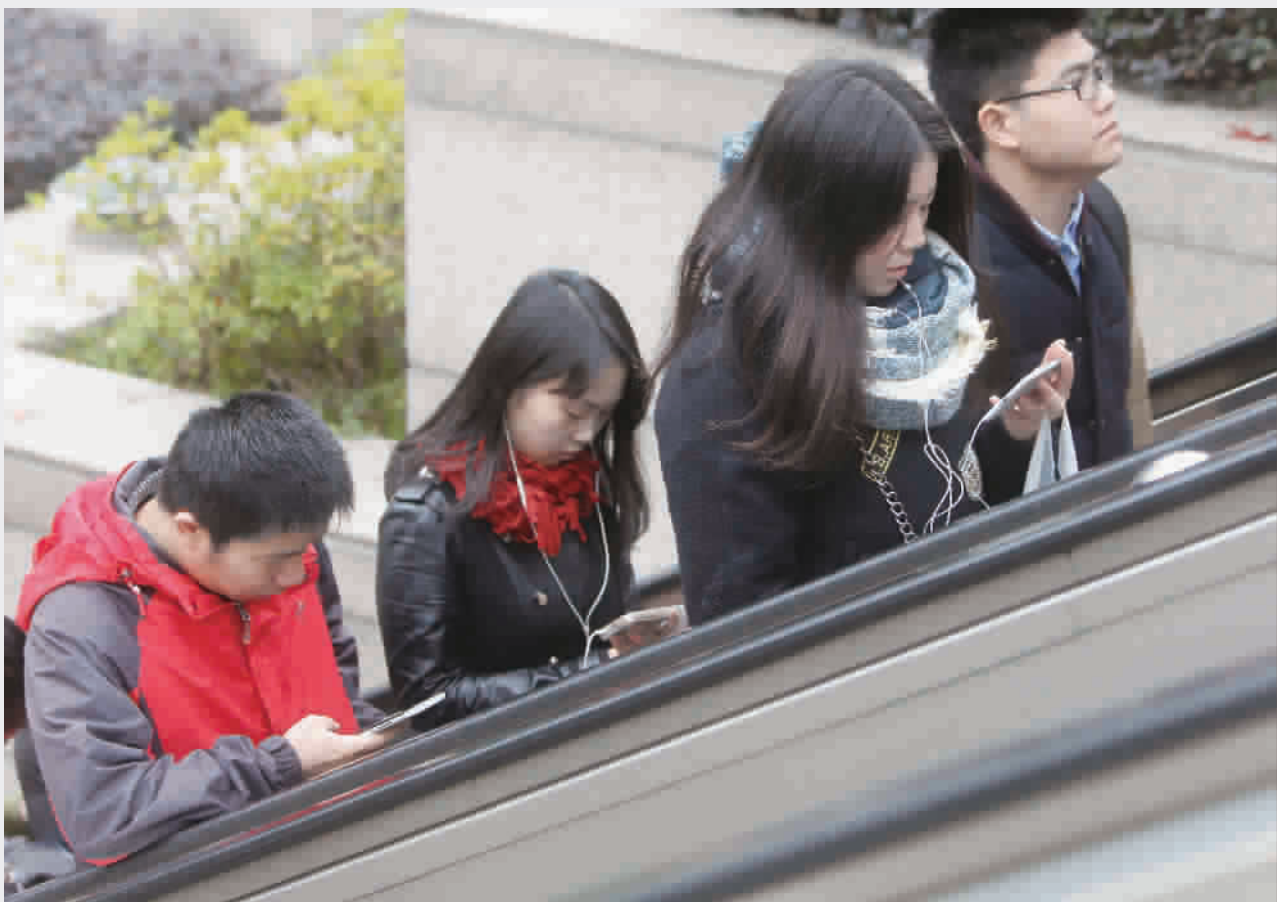
■ 站在电梯上,瞅上一会会也好

移动通讯设备在给我们提供大量资讯、带给我们极大生活便利的同时,也带来了它的副产品。但是移动设备的开发远不止于此,未来,当它们全面进驻我们的生活时,一切该会变成怎样?