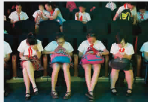
■ 报告休息间歇,学生们人手一机,忙得不亦乐乎