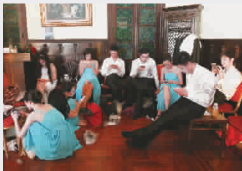
■ 剧场后台,演员们不约而同地看手机