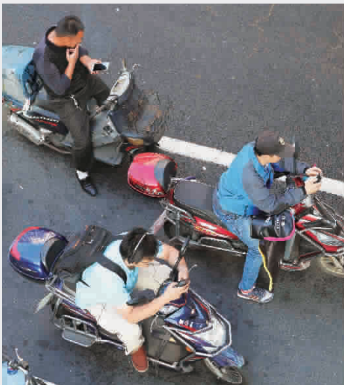
■ 等待绿灯的时候,骑车人抓紧时间掏出了手机