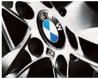
■ BMW X1 M运动限量版轮毂