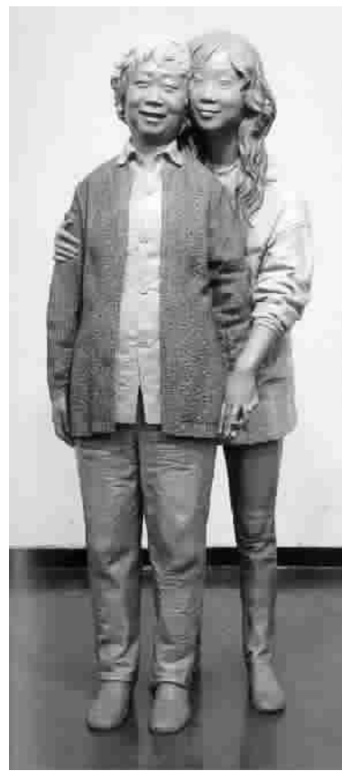
春暖花开(玻璃钢) 池灏

再说戴爱莲。1979年,她应美国拉班舞蹈中心之邀,赴美国参加世界舞蹈大师鲁道夫·拉班诞辰一百周年活动,在伦敦逗留期间,她又见到了睽